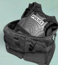
付属のギアバッグ