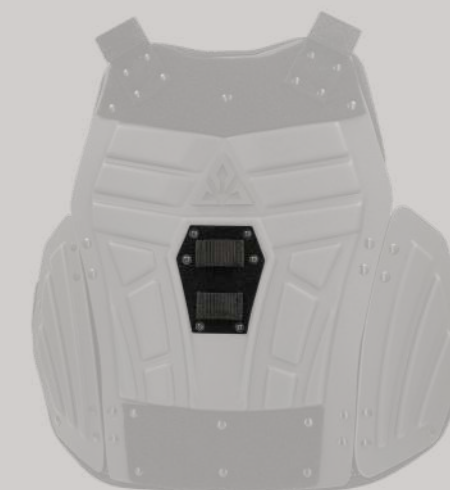
PX6 タクティカルライオット スーツ装着例