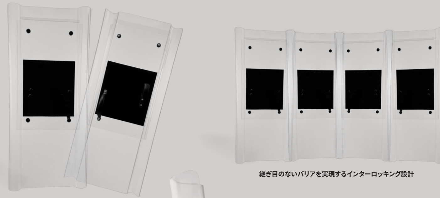
継ぎ目のないバリアを実現するインターロック設計